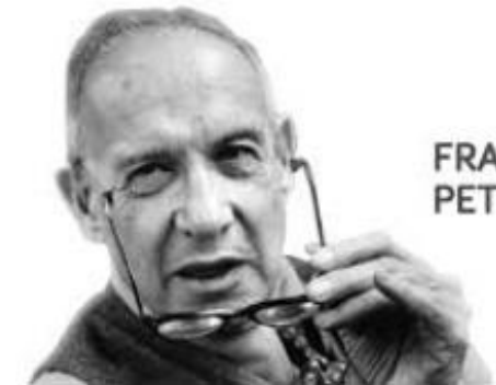
FRASES DE PETER DRUCKER

Todas as outras coisas são resultados de liderança”