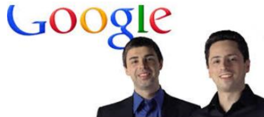
Larry Page e Sergey Brion