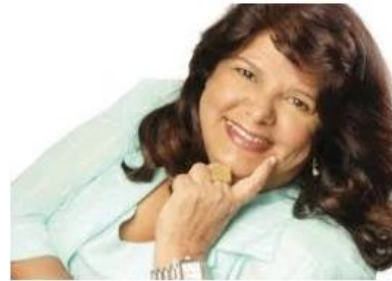
Luiza Helena Trajano